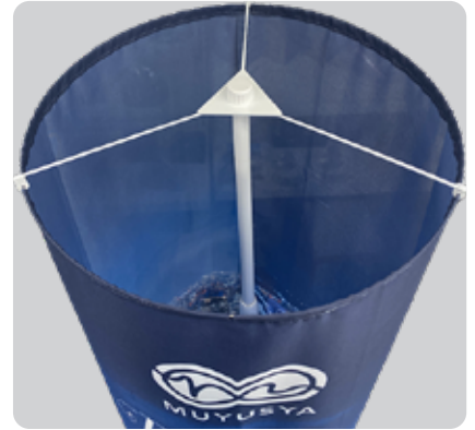
③ のぼりポールにはめるだけで、360°の立体バナーの完成！